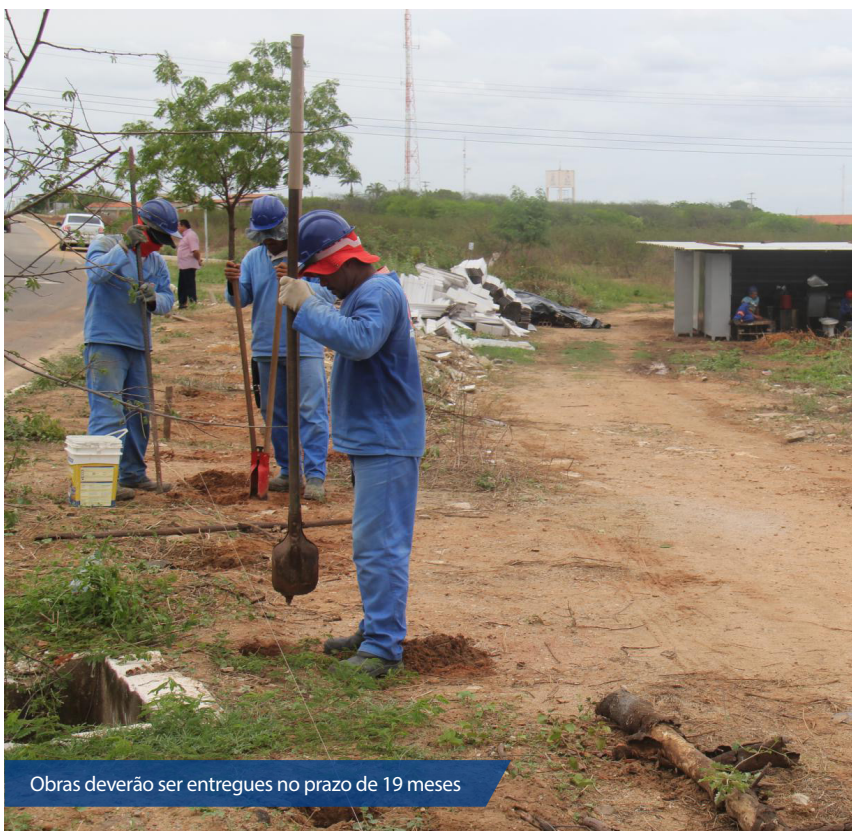
Obras deverão ser entregues no prazo de 19 meses

Governo atenderá três regiões de Saúde que abrigam 65 municípios, beneficiando diretamente mais de 800 mil habitantes