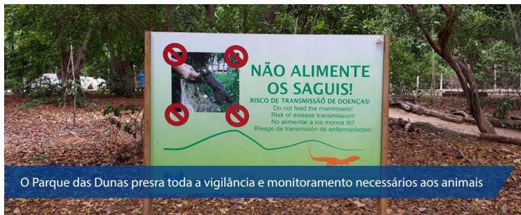
O Parque das Dunas presra toda a vigilância e monitoramento necessários aos animais