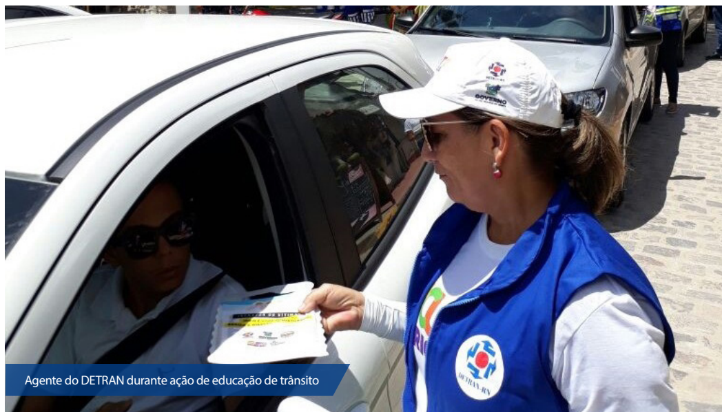
Agente do DETRAN durante ação de educação de trânsito

Os técnicos do DETRAN atuaram em parceria com os servidores do Instituto de Desenvolvimento Sustentável e Meio Ambiente (IDEMA) que orientaram os condutores a evitar poluir as praias, principalmente com o descarte de lixo na faixa de areia. Nessa situação, foram distribuídas lixeirinhas automotivas com a logomarca da